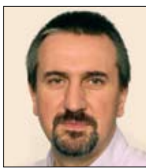
Боб Пламридж, Председатель правления, SNIA (Storage Networking Industry Association) Европа