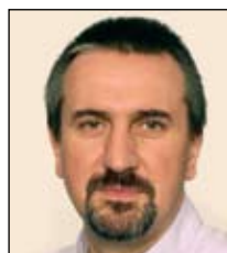
Боб Пламридж, Председатель правления, SNIA (Storage Networking Industry Association) Европа